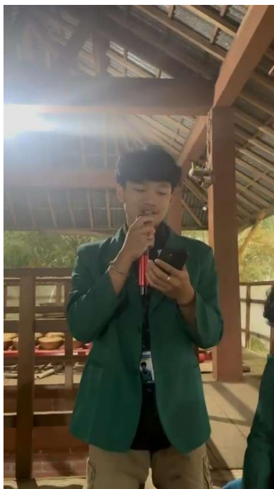
Gambar 3.2: Sesi tanya jawab materi tata cara berpengadilan