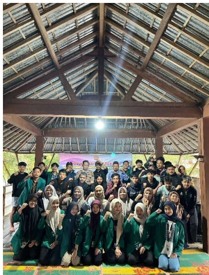
Gambar 1.1: Sosialisasi Bahaya Judi Online, Narkoba, dan Tata Cara Berperkara di Pengadilan