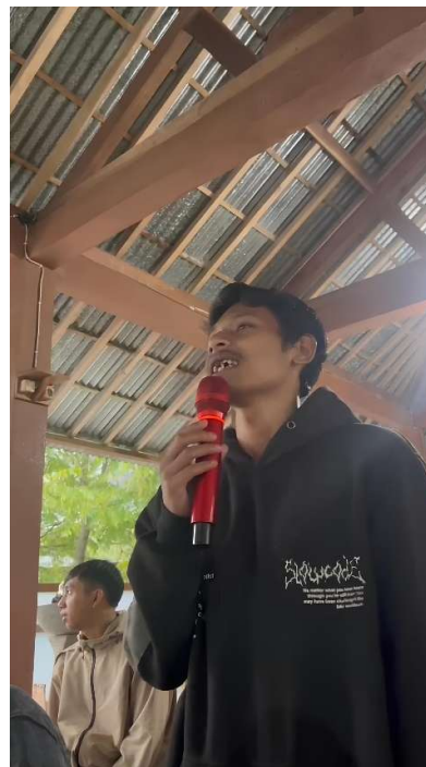
Gambar 3.1: Sesi tanya jawab materi Narkoba dan judi online