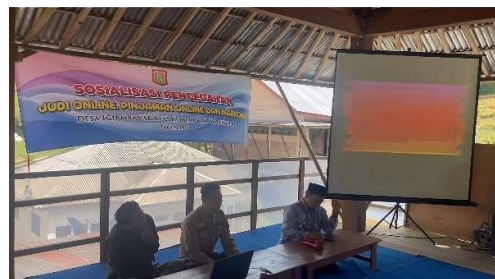
Gambar 3.3: Penyampaian materi