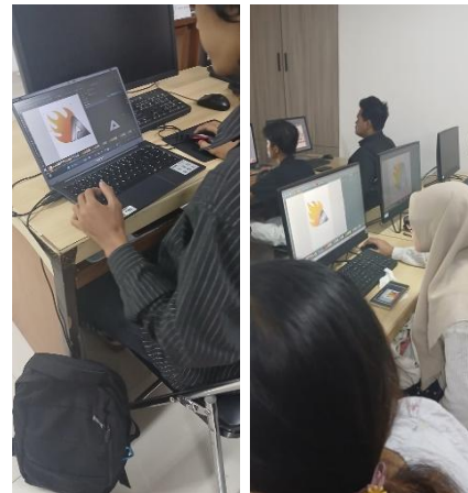
Gambar 2. Proses Hasil Pembuatan Logo

Sebagian desain bahkan langsung digunakan oleh organisasi peserta untuk publikasi kegiatan terbaru mereka. Ini menunjukkan bahwa dampak pelatihan tidak hanya berhenti pada peningkatan keterampilan, tetapi juga berkontribusi langsung terhadap peningkatan kualitas komunikasi digital organisasi.