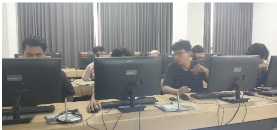
Gambar 1. Peserta Workshop dan Pelatihan

Dari sisi teknis, penguasaan Inkscape juga mengalami peningkatan signifikan. Peserta yang sebelumnya belum familiar dengan fitur desain vektor, kini mampu menggunakan berbagai tools seperti shape tool, node editing, path operation, gradient, dan color palette generator. Peserta juga mampu membuat desain yang lebih presisi dan profesional dibandingkan sebelum mengikuti workshop. Keterampilan ini sangat penting karena desain vektor merupakan standar utama dalam pembuatan identitas visual digital yang fleksibel dan dapat diperbesar tanpa kehilangan kualitas.