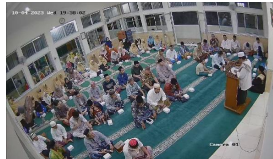
Gambar 3. Tilawatil Quran