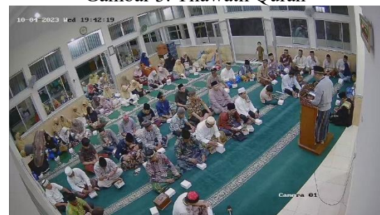
Gambar 4. Sambutan Ketua Panitia