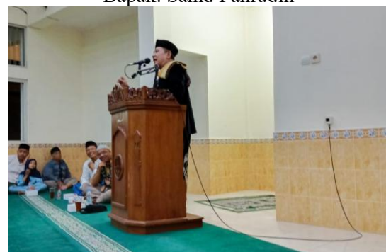
Gambar 6. Acara Inti Tausiyah

Kegiatan inti yang diakhiri dengan doa penutup segera diikuti dengan sesi ramah tamah yang mempererat keakraban antarwarga RW 40 Pringwulung. Suasana di Masjid An-Nur