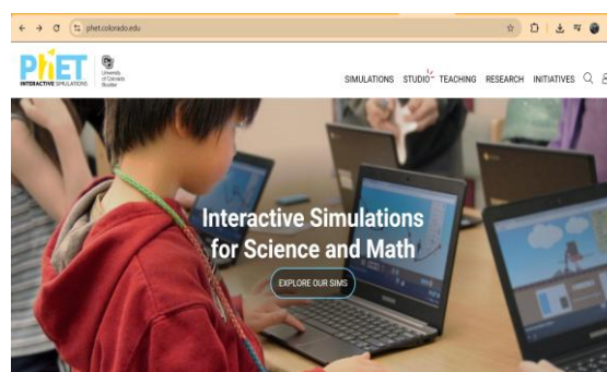
Gambar 1. Aplikasi interaktif PhET

Kegiatan pengabdian kepada masyarakat ini menghasilkan sejumlah capaian yang dapat dikelompokkan menjadi tiga aspek utama: peningkatan kompetensi guru, peningkatan literasi sains siswa, dan terbentuknya ekosistem pembelajaran digital di sekolah mitra.